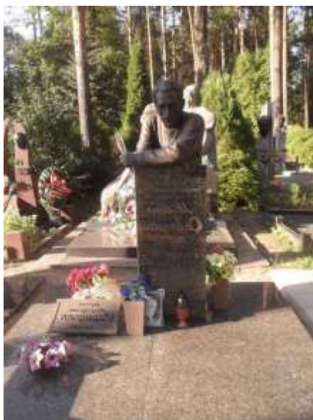
Памятник на могиле Савицкого

Память. В сентябре 2012 года в Минске состоялось открытие художественной галереи Михаила Савицкого (пл.Свободы, 15), в которой собраны многие картины художника. Также в Минске на доме по адресу Беломорская, 17 (там, где жил художник) установлена мемориальная табличка в его честь.