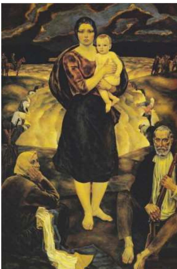
Михаил Савицкий. Партизанская мадонна. 1978 г.

Вместе с отдельными картинами создал художественные циклы «Беларусь партизанская» (1960—1980-е годы), «Цифры на сердце» (1974—1987), «Черная быль» (1988—1989), «Заповеди блаженства» (1990-е годы), «XX век» (1990—2000-е годы). Многие его ранние работы не сохранились. Среди видных картин также: «Партизаны» (1963), «Реквием» (1988), др. «Партизанская мадонна» была отмечена серебряной медалью АХ СССР. «Христианские мотивы у Савицкого появились довольно рано», позже «зазвучав в его искусстве во всю силу».