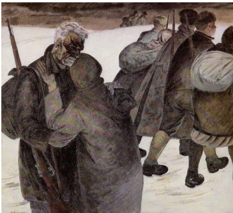
Михаил Савицкий. В партизаны. 1969 г.